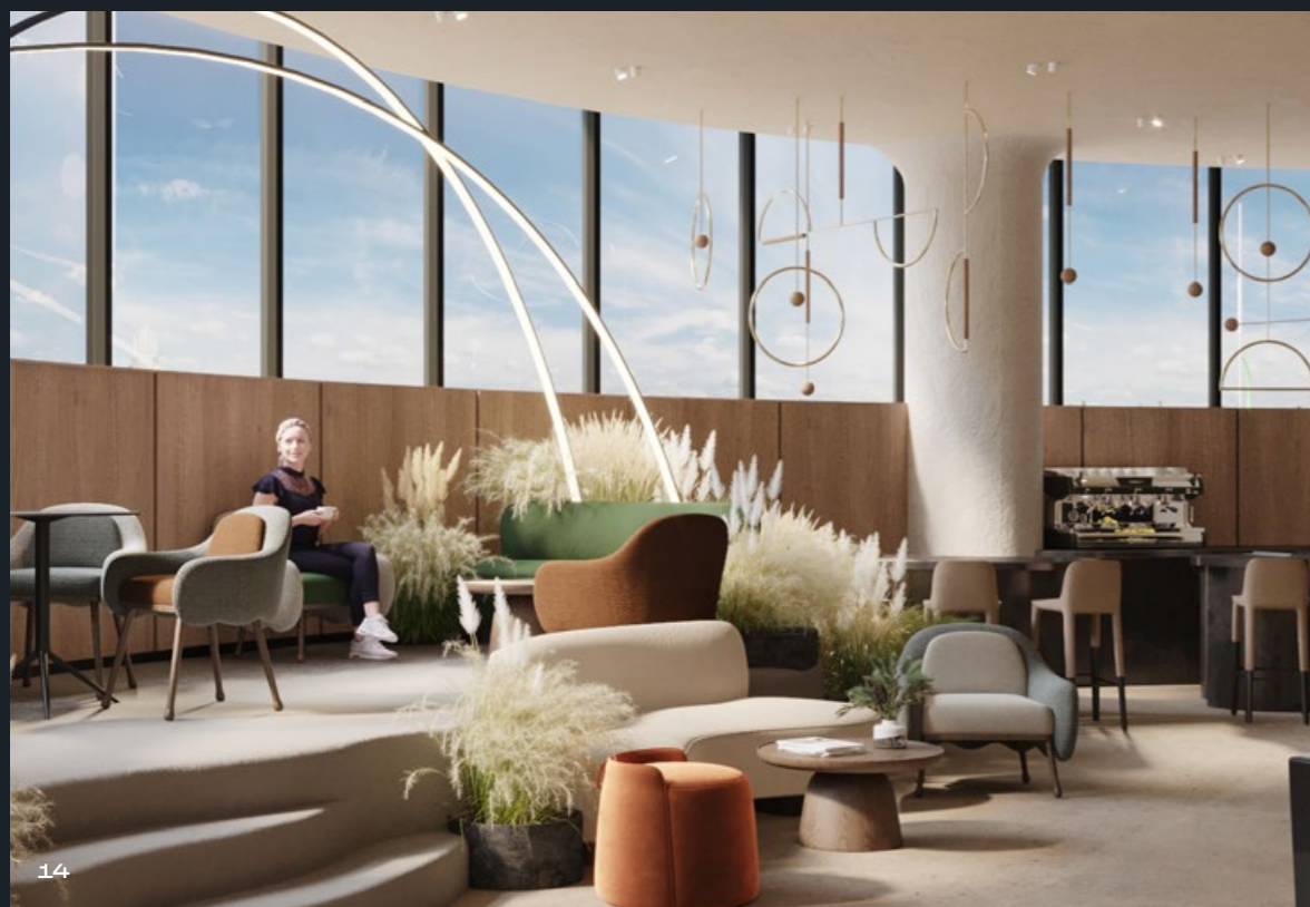
Соседский центр с террасой на свежем воздухе