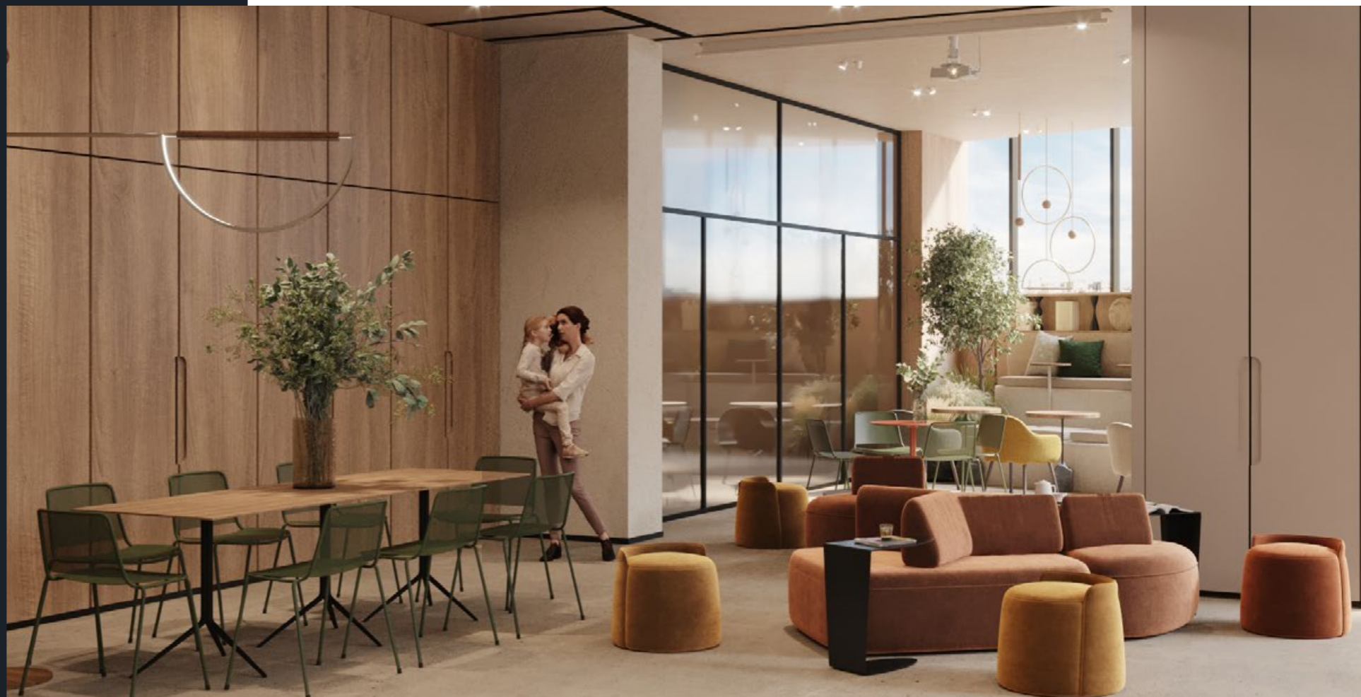
Friend's Lab в доме «Достижение»

Friend's Lab — фирменный стандарт Smineх, в рамках которого для создания круга знакомств между жителями дома и укрепления добрососедских отношений предусмотрены организация соседских центров и внедрение сопутствующих сервисов силами комьюнити-менеджеров.