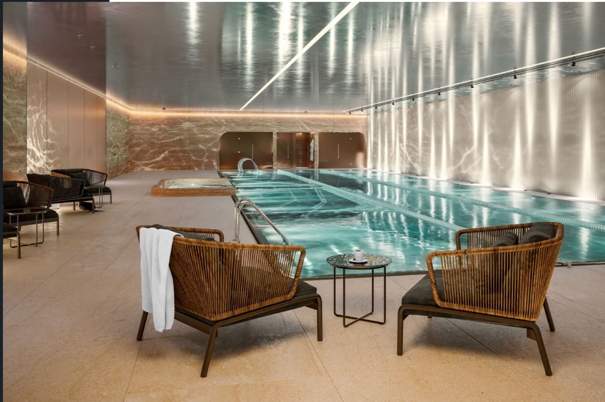
Бассейн с хот-табом в Fit Lab дома «Лаврушинский»

Fit Lab — стандарт инфраструктуры для здорового образа жизни от Sminex. В его разработке принимали участие эксперты, создававшие лучшие фитнес-центры в Москве.