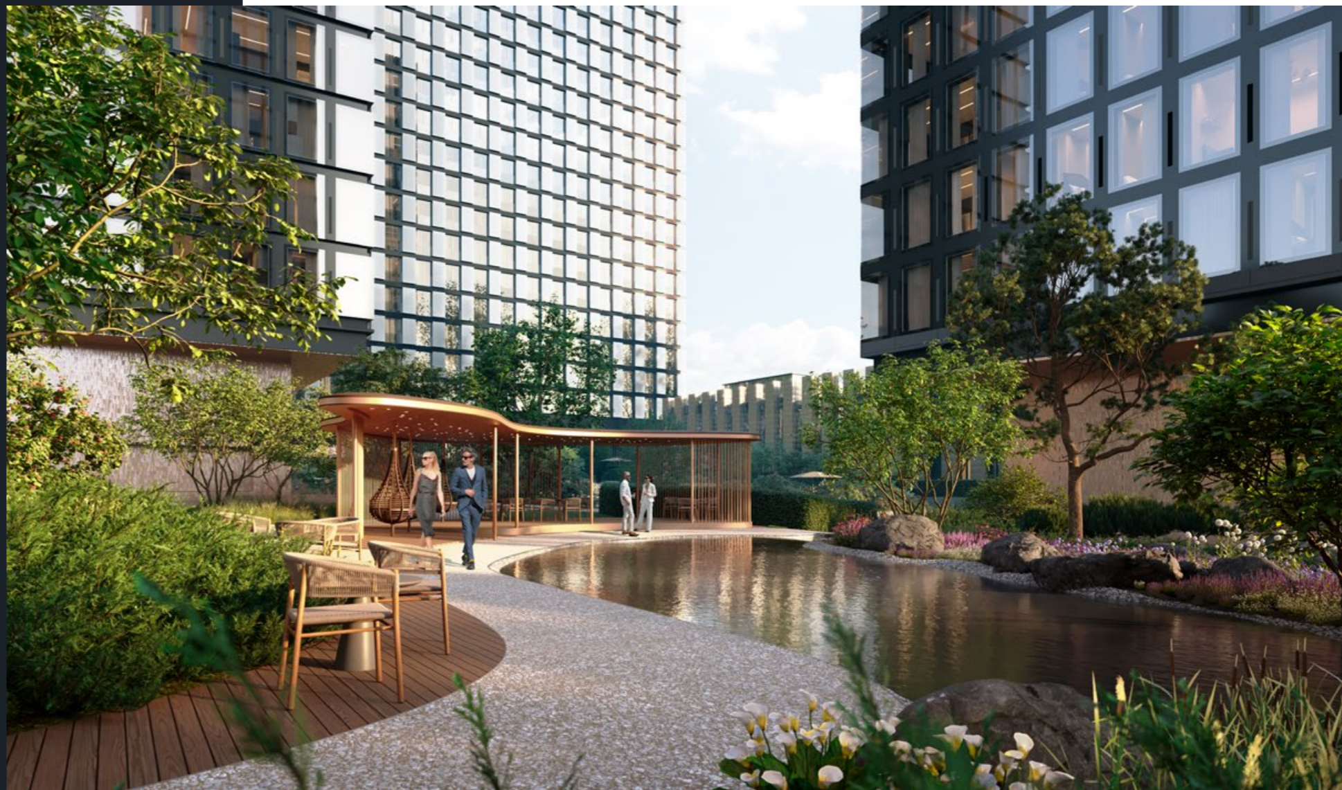
На просторной и закрытой территории двора-парка царит атмосфера загородной тишины и безмятежности