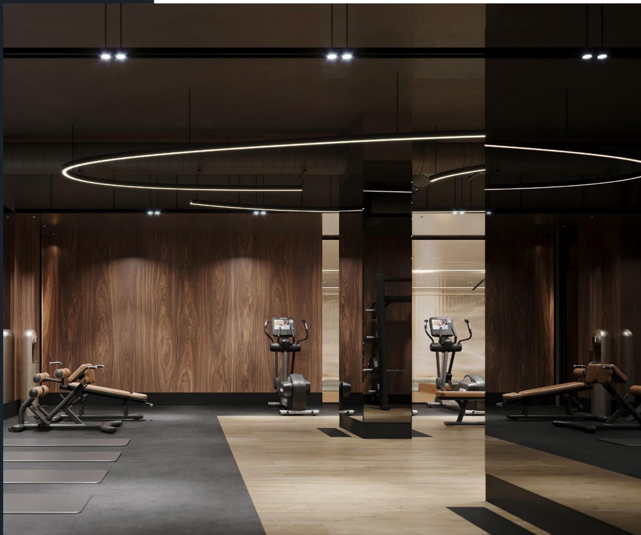
Фитнес-зал по стандарту Fit Lab в доме «Лаврушинский»

Представлено оборудование для всех групп мышц и стилей тренировок.