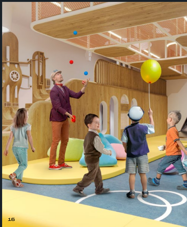
Игровая комната в Kid's Lab дома «Лаврушинский»

Чтобы подышать свежим воздухом и дать выход энергии, достаточно спуститься в оснащённый всем необходимым закрытый для посторонних двор-парк. Дети всегда найдут, чем заняться: три игровые площадки рассчитаны на ребят разного возраста, есть встроенная в рельеф необычная горка, водоёмы, сухой фонтан и настоящий ручей для запуска корабликов и игр с водой.