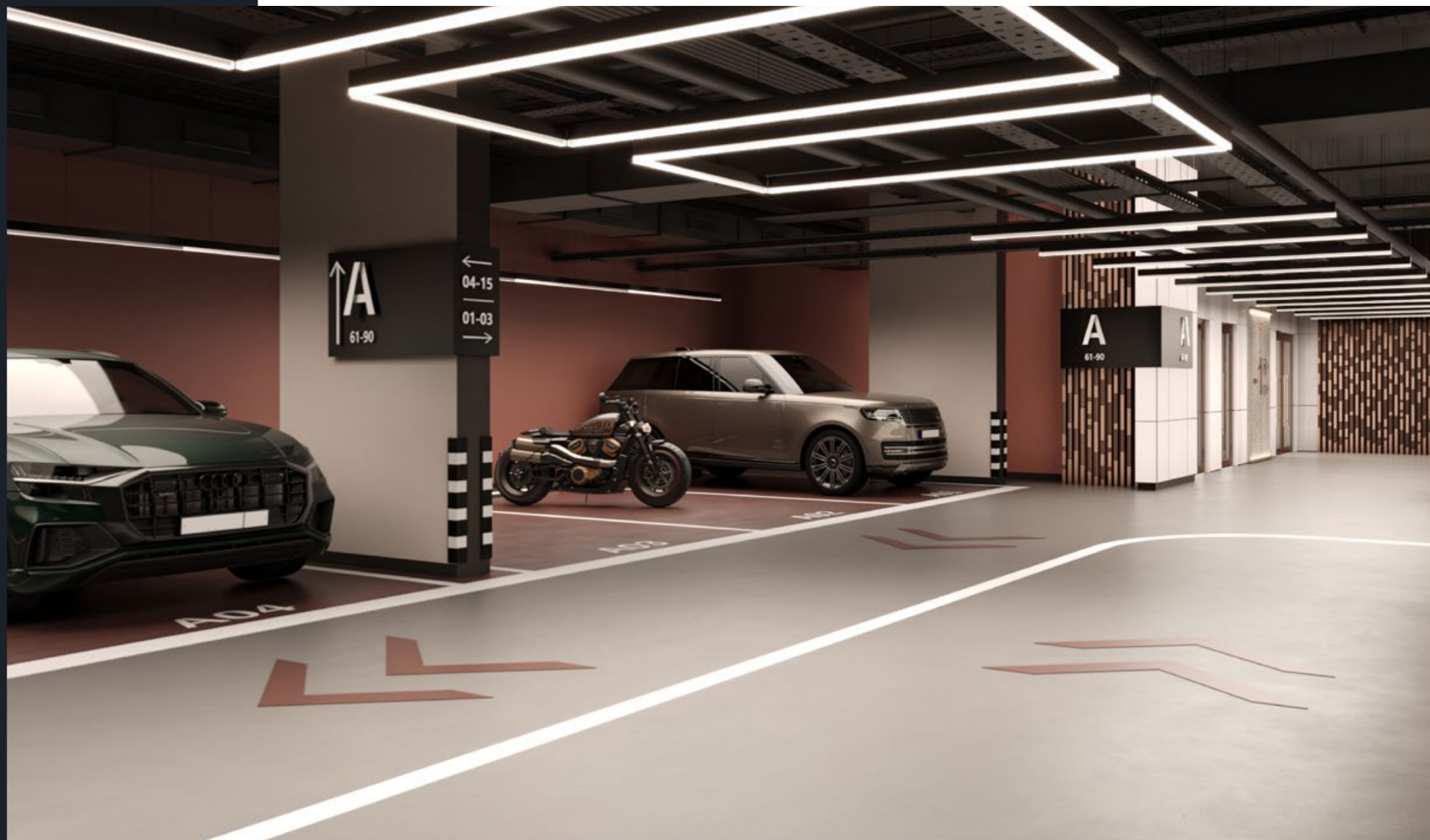
Просторные и комфортные парковочные места, чтобы вы с комфортом селись в любой автомобиль и выходили из него