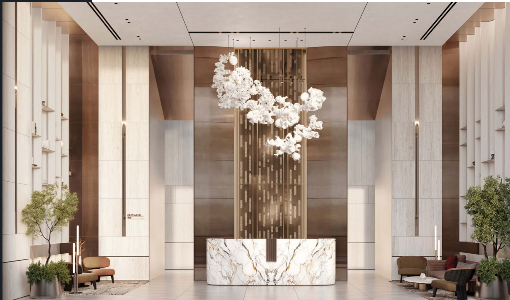
Просторные лобби с безупречным дизайном