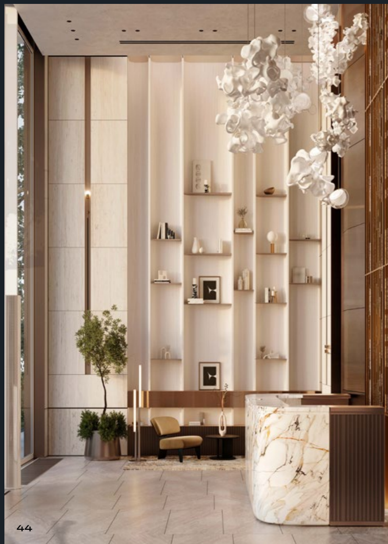
Зона ресепшен в лобби

Просторные дизайнерские лобби отличает сдержанная роскошь.