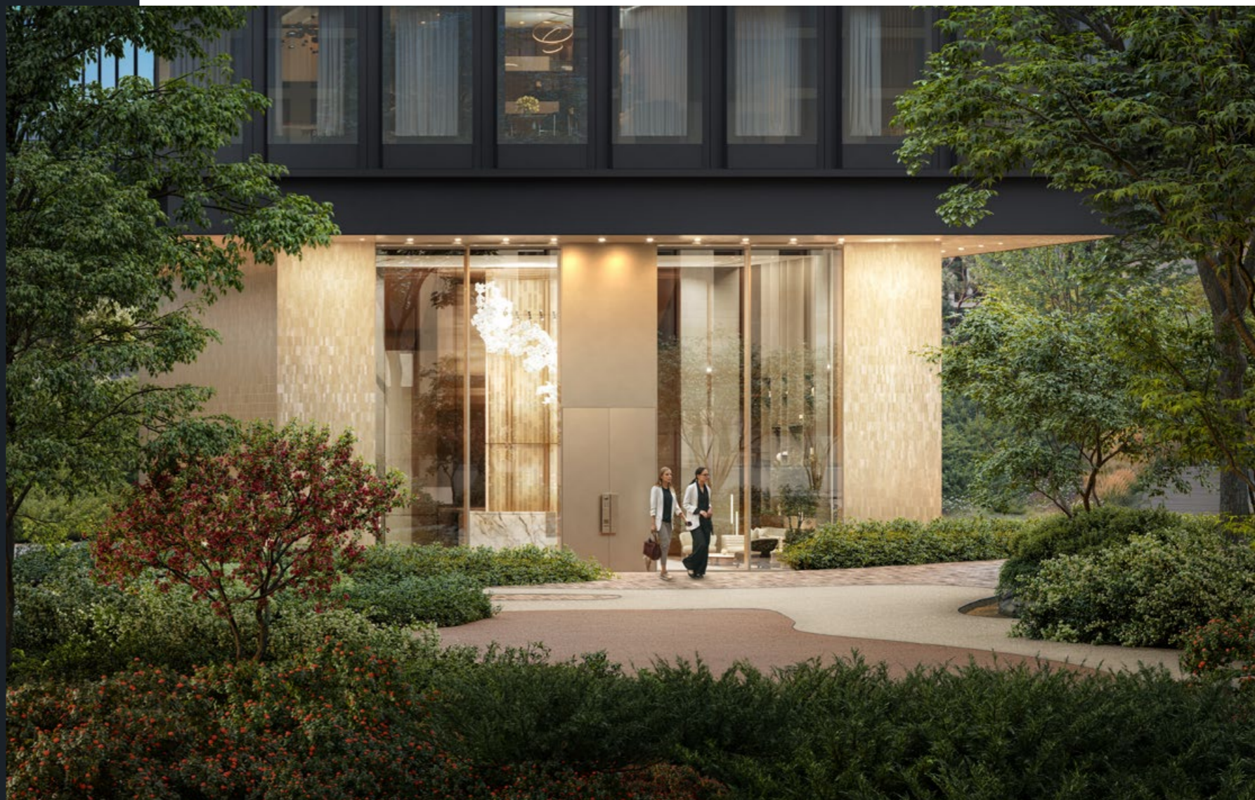
Жителей встречают элегантные лобби с высотой потолков 7 метров

Главная особенность башен — непрерывное панорамное остекление вдоль всего фасада