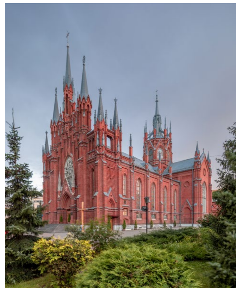
Римско-католический кафедральный собор Непорочного Зачатия