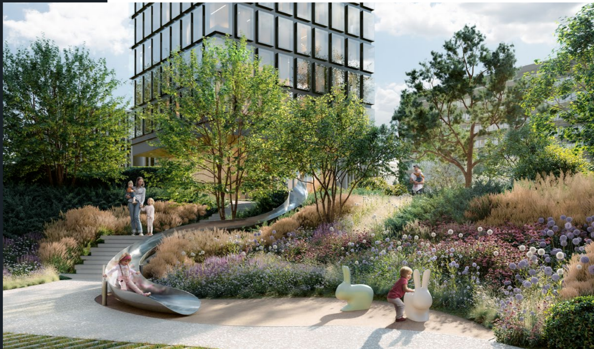
Безопасный закрытый двор-парк для прогулок и игр

Почувствуйте себя родителями, которые всё успевают и при этом дают своему ребёнку самое лучшее. В считанных шагах от вашей квартиры детский сад и частная школа.