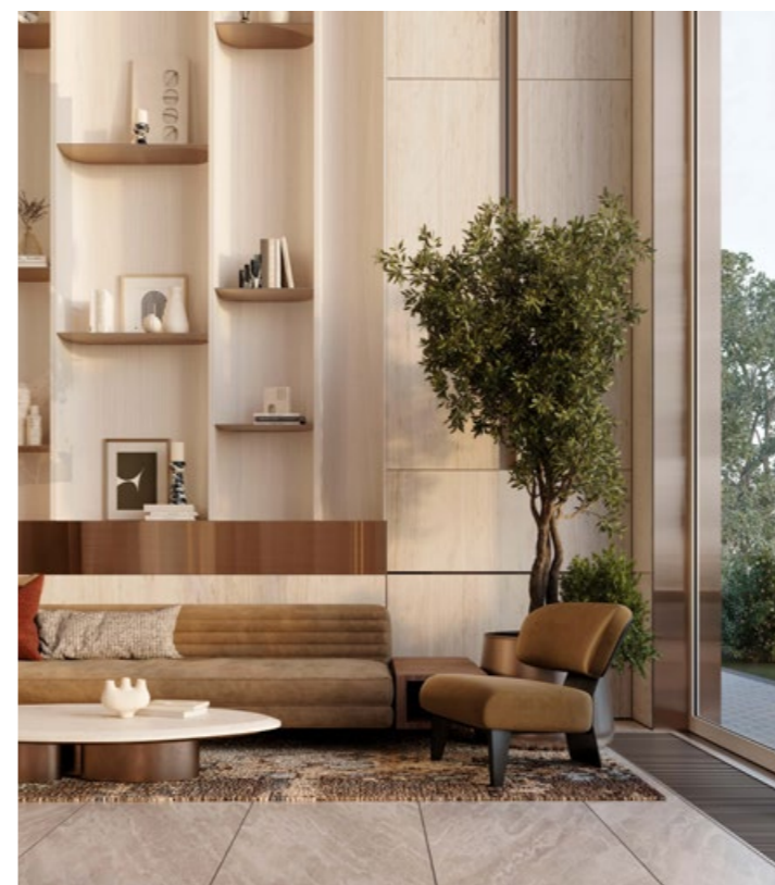
Зона ожидания в лобби

Дорогие материалы (натуральный камень, текстурированное стекло), атмосферное освещение, потолки высотой до 7 метров, консьерж, который сэкономит ваше время и быстро решит любой вопрос, зона ожидания с дизайнерской мебелью, комната для хранения колясок и детских велосипедов, гостевой санузел.