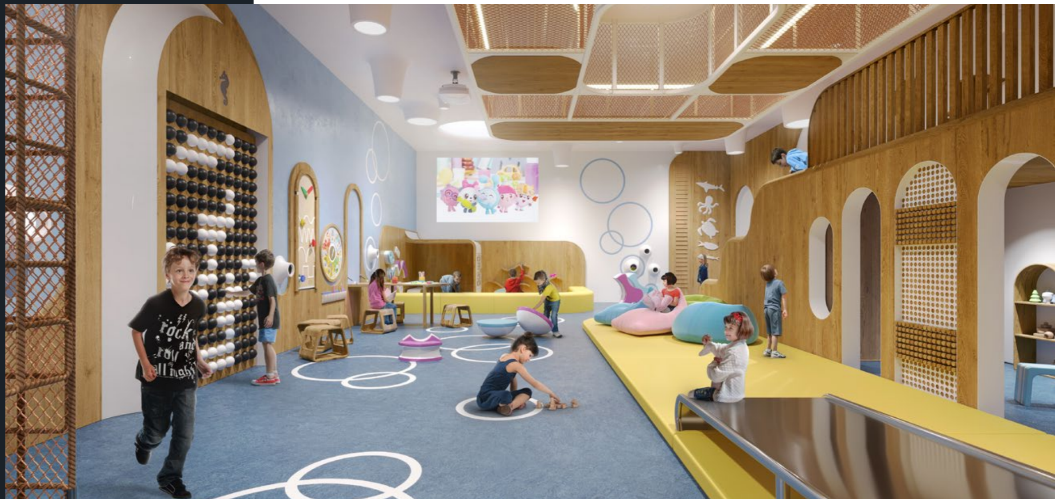
Горки, подвесной лабиринт, пинбол в игровой комнате в доме «Лаврушинский»

Стандарт детских пространств от Smineх разработан для гармоничного развития маленьких жителей с учётом современных открытий в области психологии и педагогики.